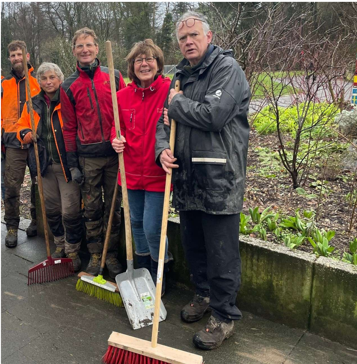
- Bild vom ersten Pflegedurchgang in 2023 -

Falls vorhanden, bringen Sie bitte eigene Arbeitsutensilien mit, weil diese nur im eingeschränkten Umfang vor Ort sind.